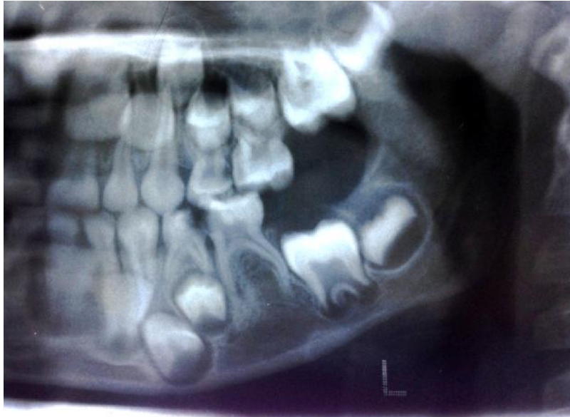
تصویر ۲: پانورامیک بیمار در ۶ سالگی - نمای نزدیک