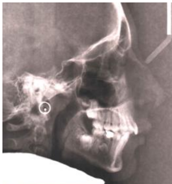
تصویر ۱: سفالومتری طرفی بیمار در ۱۲ سالگی

فضا با حرکت مزایالی دندانهای خلفی، و نهایتاً حالت سوم نگهداری دندان شیری به شرط داشتن ریشه های مناسب می باشد که البته ممکن است جهت هماهنگی با سایر دندانهای دائمی در اکلوزن نیاز به مختصری تغییر فرم داشته باشد. در صورت نگهداری دندان شیری بایستی بیمار را آگاه نمود که ممکن طی سالهای آینده دندان شیری از بین رفته و نیاز به جایگزینی یا بستن فضا داشته باشد و در واقع نگهداری دندان شیری یک راهکار موقت یا میان مدت می باشد. در صورتی که بستن فضای دندان غایب به عنوان طرح درمان ارتودنسی بیمار مد نظر قرار گیرد اغلب ارتودونتیست عجله ای در گذاشتن دستگاه ثابت ارتودنسی نداشته و ترجیح میدهد با کشیدن دندان مولر دوم شیری اجازه حرکت مزایالی خودبخودی را به دندان مولر اول دائمی را بدهد. بایستی خاطر نشان کرد در صورتی که سن بیمار بیش از ۶ سال باشد ممکن است جلو آوردن دندان مولر اول دائمی با حضور دستگاه ثابت ارتودنسی ترجیح داده شود. توجه به این نکته ضروری است که کشیدن دندان مولر دوم شیری در سن ۶ سالگی و انتظار حرکت مزایالی خودبخودی مولر اول دائمی ممکن است خطراتی را در بر داشته باشد که این خطرات به طور کلی شامل تکامل تاخیری پره مولر دوم دائمی و در نتیجه نهفتگی آن و ریسک تحلیل ریشه دندانهای اطراف در نتیجه مجاورت با تاج دندان در حال تکامل می باشد.