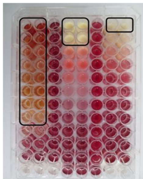
شکل 1: شکل سمت راست مربوط به S. aureus و شکل سمت چپ مربوط به C. perfringens