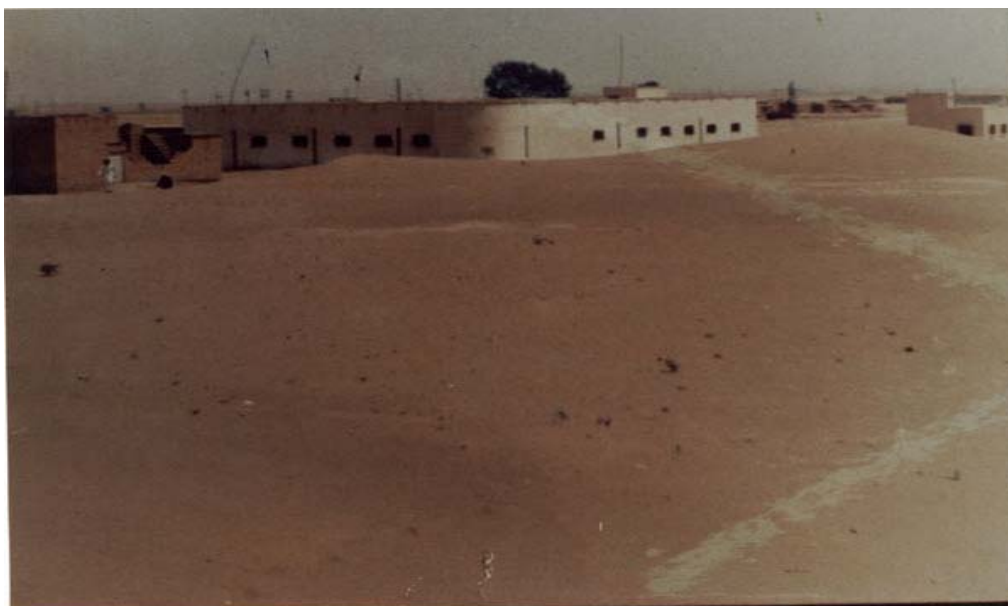
شکل ۳: تخریب منازل روستایی در اثر طوفانهای گرد غباری (۶).

به‌ازای افزایش ۱۰ میکروگرم در متر مکعب در غلظت ذرات کوچکتر و مساوی ۱۰ میکرون، همراه با ۱٪ افزایش کل مرگ و میر است (۳۴). بر اساس استاندارد هوای پاک نباید در طول سال غلظت دو آلاینده کل ذرات معلق و ذرات کوچکتر از ۱۰ میکرون بیش از یک بار از حد استاندارد تجاوز کند (۳۵).