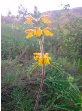
شکل ۱: گیاه E.labiosiformis

برای تعیین آستانه سمیت سلولی عصاره متانولی E.Labiosiformis با روش MTT، سلول‌های Vero به تعداد مناسبی (۶۰۰۰ سلول/چاهک) در میکروپلیت ۹۶ خانه‌ای کشت داده شدند آنگاه به مدت ۲۴ ساعت در گرمخانه ۳۷ درجه سانتیگراد و ۵٪ CO 2 قرار گرفتند تا تک لایه سلولی تشکیل گردد. سپس از گرمخانه خارج و در زیر هود، غلظت‌های مختلف عصاره متانولی E.labiosiformis (۲۰۰۰، ۱۰۰۰، ۵۰۰، ۲۵۰، ۱۲۵، ۶۲/۵، ۳۱/۲۵ میکروگرم/ میلی‌لیتر) به سلول‌ها افزوده گردید. چاهک‌های کنترل نیز شامل کنترل سلول که محتوی سلول و محیط کشت کامل و کنترل بلانک که بدون سلول و محیط کشت کامل است تعیین و میکروپلیت‌ها تا زمان‌های مورد نیاز (۷۲-۴۸-۲۴ ساعته) مجدداً در گرمخانه ۳۷ درجه سانتیگراد و ۵٪ CO 2 قرار گرفتند. بعد از طی زمان‌های مورد آزمایش، سلول‌ها با فسفات سالیین PBS شستشو شدند رنگ MTT به