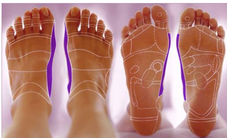
شکل ۱: نقاط رفلکسی مربوط به مهره های کمر و ستون فقرات با رنگ تیره و سایر نقاط رفلکسی بدن، بدون رنگ از یکدیگر جدا و مشخص شده اند.

نمودار ۱: مقایسه تفاوت میانگین و انحراف استاندارد پیش آزمون و پس آزمون در سه گروه حرکت درمانی و رفلکسولوژی و کنترل