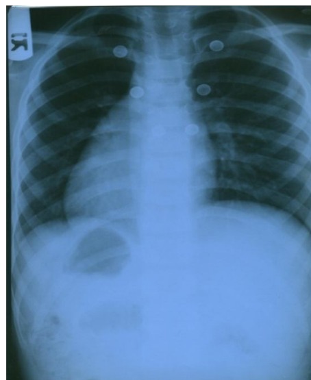
تصویر ۱: رادیوگرافی قفسه صدی

در جریان انجام برنامه بررسی سلامت دانش آموزان دبستانی، حین بررسی و معاینه فیزیکی دانش آموزان کلاس سوم ابتدایی یکی از دبستان های شاهد شهر سبزوار، سمع قلب دانش آموز پسر ۱۰ ساله ای، در سمت چپ قفسه سینه خیلی ضعیف بود، با جابجایی گوشی به سمت راست قفسه سینه، صداهای قلبی واضح تر سمع شد و تشخیص احتمالی دکستروکاردی و یا Situs inversus مطرح گردید [۱۰]. ضمن هماهنگی با مربی بهداشت و مسئولین محترم آموزشگاه، با خانواده دانش آموز تماس گرفته شد و با ارائه توضیحات کافی به والدین