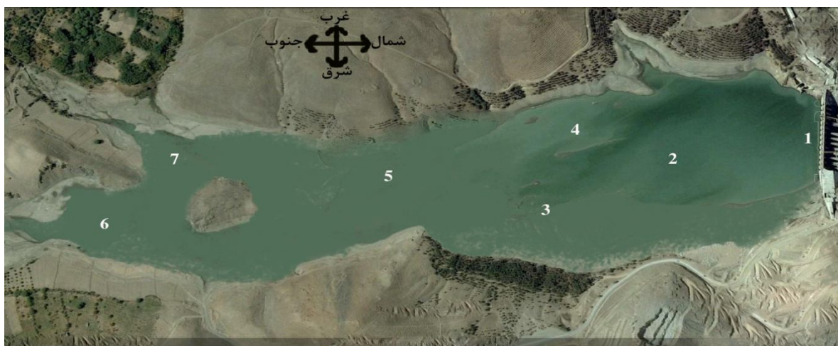
شکل ۱: نقشه ماهواره ایی دریاچه و موقعیت ایستگاه های نمونه برداری [۱۰]