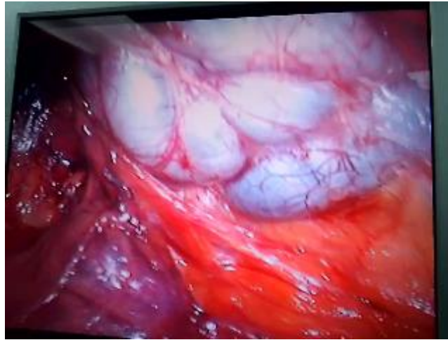
شکل ۳: نمای لاپاروسکوپیک کیست سمینال وزیکل چپ بعد از باز کردن پریتونن در لگن