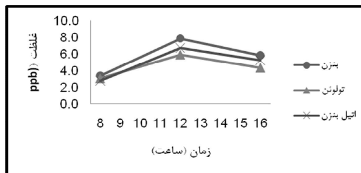
شکل ۱: تغییرات روزانه غلظت بنزن، تولوئن، اتیل بنزن در سال ۱۳۹۰