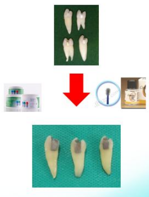
تصویر ۱: تراش حفره و ترمیم با آمالگام