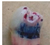
تصویر ۴: برداشتن Nail varnish از سطح نمونه و برش دندان از زیر ناحیه نفوذ رنگ

شده است این روش ها شامل fluid filtration، Dye extraction، penetration و bacterial leakage می باشند. کمپس ۲ و پشلی ۳ [۱۴] نشان دادند که روش Dye extraction نتایج مشابه fluid filtration دارد، در عین حال ساده تر انجام می شود. استفاده از وارنیش زیر آمالگام ریزنشت اولیه را کاهش داده و جلوی نفوذ رنگ ناشی از محصولات کروژن به داخل ساختار دندان را می گیرد، [۱] در صورتی که هالس ۴ و تویت ۵ [۱۵] همچنین متیر ۶ و ریتز ۷ [۱۶] نشان دارند که وارنیش جریانبات الکتریکی را مسدود نمی کند. بنابراین نمی تواند به عنوان عایق مناسبی در برابر نفوذ یونهای قلع و نقره باشد.