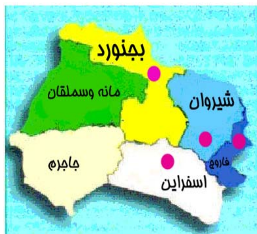
شکل ۳: موقعیت مناطق جغرافیایی در استان خراسان شمالی

خشک نگردند. هر هفته نقاط سفیدی که در روی موها ظاهر می شد و نشان دهنده کلنی های قارچ بود جدا و در پلیت های حاوی (YPDA) Yeast Pepton Dextrose Agar [Merck, Germany] حاوی 0.1\% کلرامفنیکل و نیز YPDA به همراه 0.1\% کلرامفنیکل و 0.1\% سیکلو هگزامید کشت داده