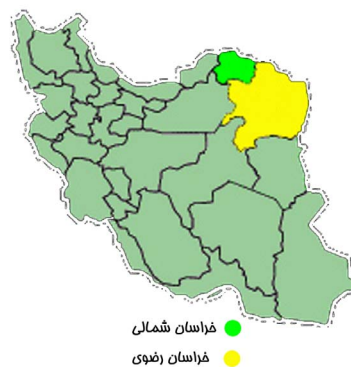
شکل ۲: موقعیت مناطق مورد مطالعه در نقشه ایران