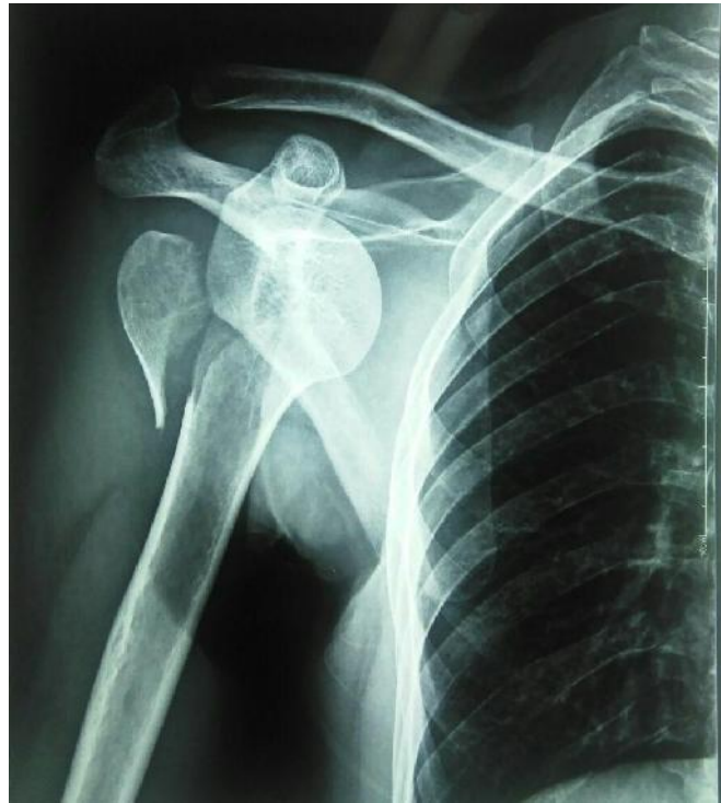
تصویر ۲: رادیوگرافی مفصل شانه راست بیمار