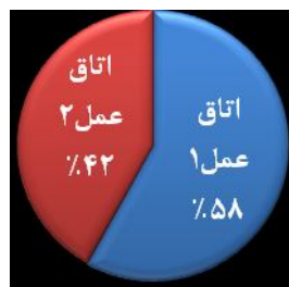
شکل ۲: درصد فراوانی کلنی های موجود در اتاق های عمل بیمارستان بنت الهدی