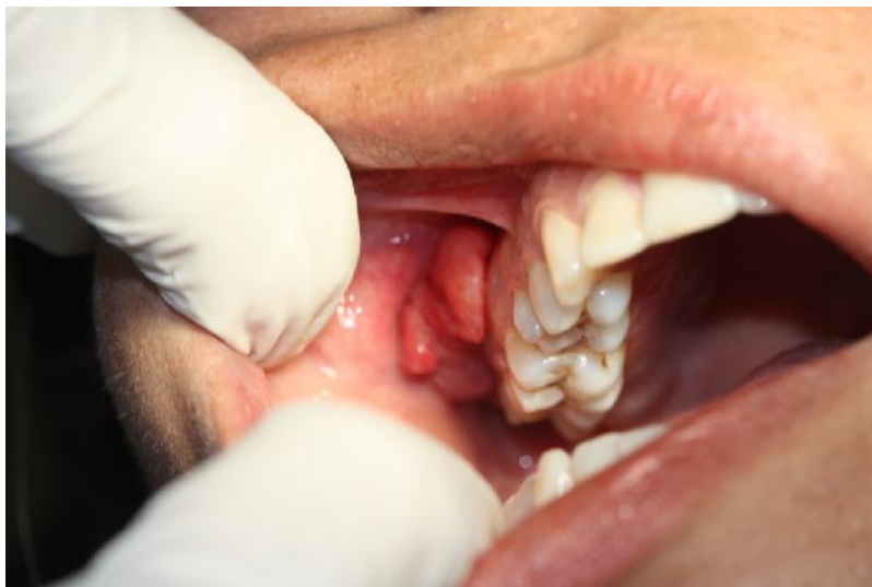
تصویر ۱: نمای بالینی ضایعه

گزارش مورد: یک خانم ۲۸ ساله با شکایت از یک ضایعه داخل دهانی، درد و تورم در خلف ماگزایلا به مدت یکسال به بخش بیماری های دهان دانشکده دندانپزشکی بابل مراجعه کرد. به گفته بیمار ضایعه طی مدت یکسال بزرگتر شده و حین مسواک زدن و غذا خوردن دچار خونریزی می شد. در معاینه بالینی بعمل آمده، ضایعه شامل یک توده اگزوفیتیک باکالی پولیپوئید با سطح لبوله و با قوام