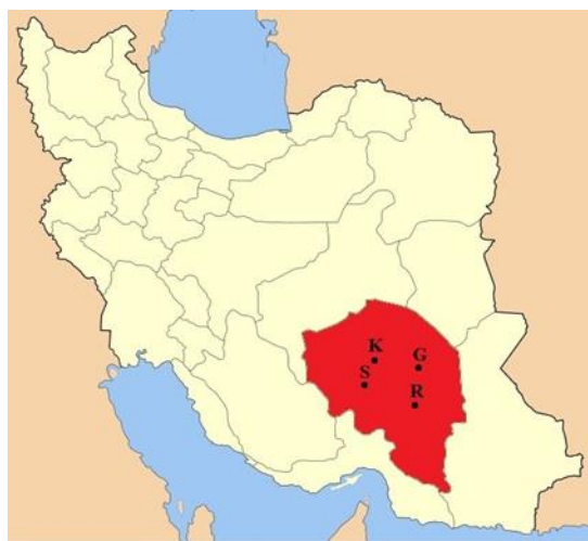
شکل ۱. موقعیت جغرافیایی شامل گلباف (G)، راین (R)، شهرستان سیرجان (S) و حومه استان کرمان (K)

استان کرمان در جنوب ایران قرار گرفته و جمعیت آن در سال ۱۳۹۵ و بر اساس آمار مرکز آمار ایران برابر با ۳۰۱۶۴۰۷۱۸ نفر بوده است. کرمان با در بر گرفتن بیش از ۱۱ درصد از وسعت ایران با حدود ۱۸۳۱۹۳ کیلومتر مربع، وسیع‌ترین استان ایران است. کرمان نهمین استان پرجمعیت کشور محسوب می‌شود. براساس آخرین تقسیمات کشوری، استان کرمان دارای ۲۵ شهرستان، ۶۱ بخش، ۱۶۸ دهستان و ۸۴ شهر است. این استان از نظر جغرافیایی بین مدارهای ۵۵ دقیقه و ۲۵ درجه تا ۳۲ درجه عرض شمالی و ۲۶ دقیقه و ۵۳ درجه تا ۲۹ دقیقه و ۵۹ درجه طول شرقی از نصف النهار گرینویچ قرار گرفته است [۱۸].