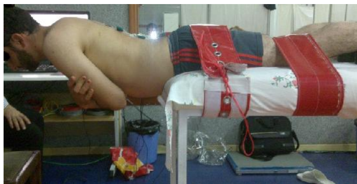
شکل ۱: نحوه اجرای آزمون بایرینگ سورنسن در این تحقیق

خم می‌شود. نواحی مفصل ران، کمی پایین تر از زانوها و کمی بالاتر از مچ پاها با استرپ محکم ثابت و به تخت بسته شدند. سپس از فرد خواسته می‌شد تا در حالی که دست‌ها را روی پیشانی قرار داده و آرنج‌ها خم و به سمت خارج امتداد داشتند، تنه خود را بر خلاف جاذبه بالا آورد و به حالت افقی تا حداکثر زمانی که می‌تواند نگه دارد. برای تشخیص خروج فرد از حالت افقی از آینه شطرنجی و مدرج که در کنار تخت و روی دیوار نصب شده بود، استفاده شد و به محض خروج فرد از حالت افقی، محقق آزمون را قطع می‌کرد. مدت زمانی که آزمودنی می‌توانست